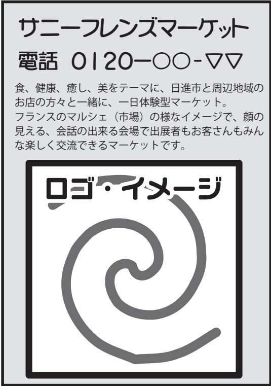
広告枠 A w70 x h100 mm