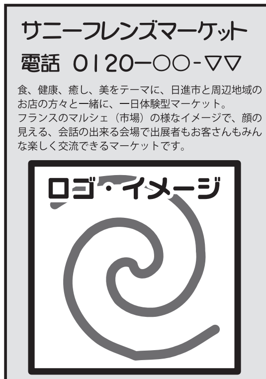
広告枠 A w70 x h100 mm